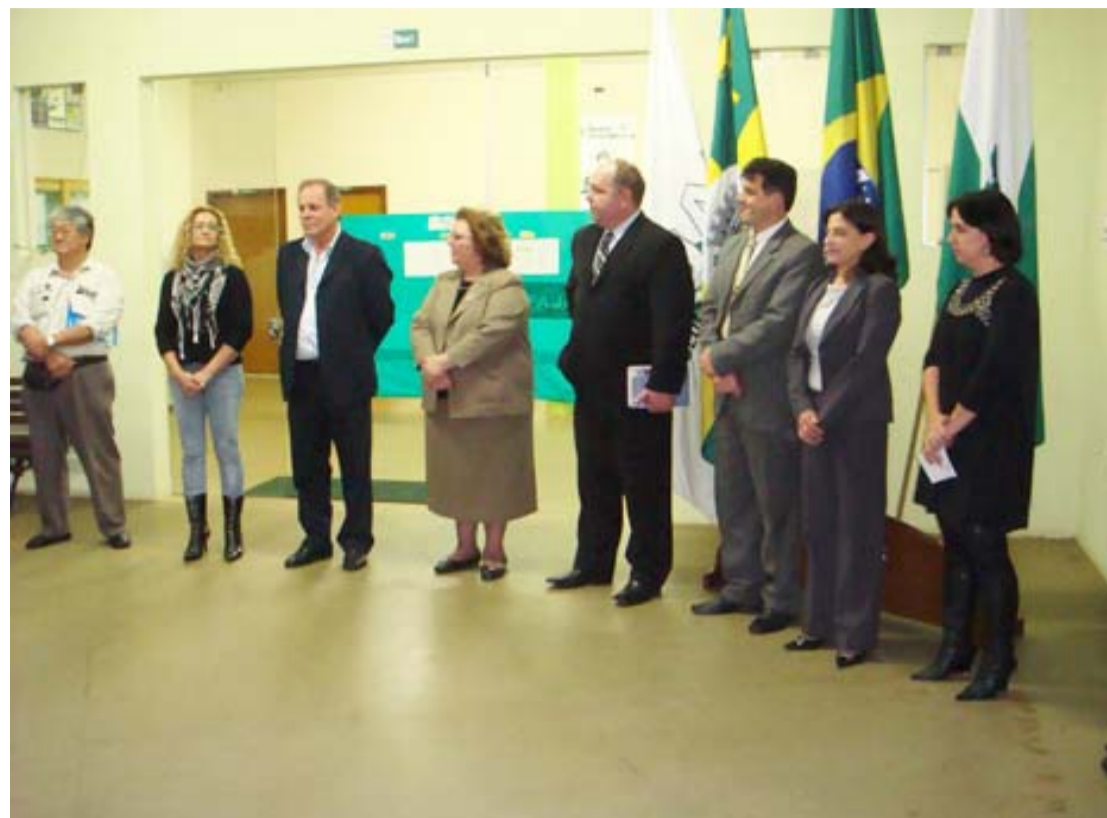
Solenidade de Abertura da IV Semana Acadêmica da FAJAR